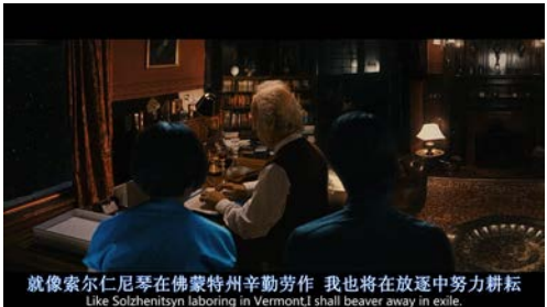
图 8 画中画错接

虽然这在全剧中只出现了一次，但却是十分新颖独特的用法。并且，《云图》的叙事结构天生就适合这一手法。