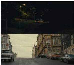
图 2 相似错接 2

图 2：上图为故事四中老人们驾车远去的场景，随后切至故事三中杀手驾车出现的场景。