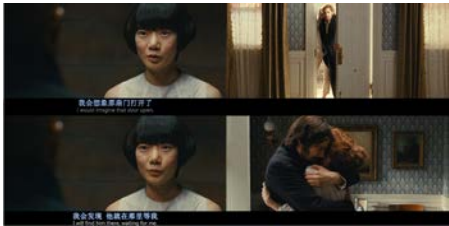
图 7 相似错接 7

图 6：左图为故事四，情节为老人被关进养老院；右图为故事五，情节为女主角被关进牢房。通过相同主题“自由”进行错接。