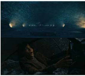
图 1 相似错接 1

图 1：上图为故事五中隧道被水淹没的场景，随后切至故事三，下图为先前被陷害连带车落入水中的女记者。