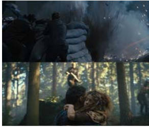
图 4 相似错接 4