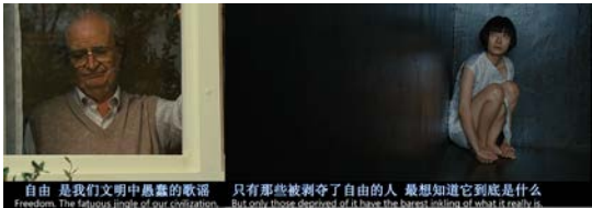
图 6 相似错接 6

图 5：左图为故事五，右图为故事一，通过相似的赤脚在桥（杆）上奔跑场景进行错接。