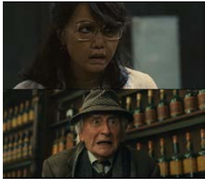
图 3 相似错接 3