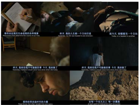
图 9 旁白错接 1