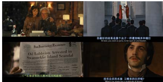
图 10 旁白错接 2

表现他在说话，而是快速切换了好几个不同故事的场景。由于高度的话语启发性和场景象征性，旁白错接的每次出现都标志着故事进入一个新阶段。